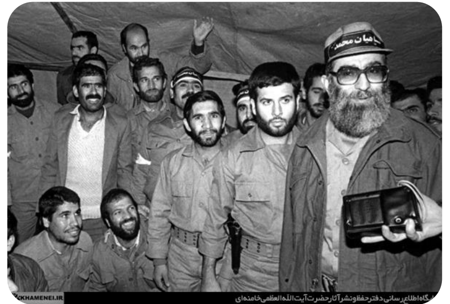
گناه اطلاع رسانی دفتر حقوق نشر آثار حضرت آیت الله العظمی خامنه‌ای

گزیده تصاویر حضور مقام معظم رهبری (مدظله العالی) در خط مقدم جبهه