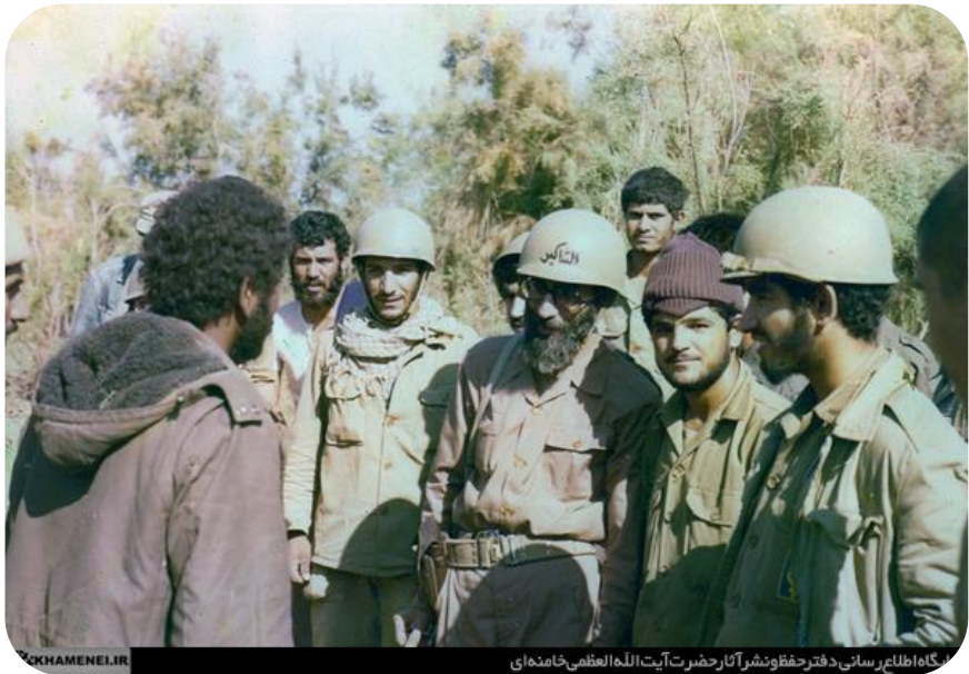
گناه اطلاع رسانی دفتر حقوق نشر آثار حضرت آیت الله العظمی خامنه‌ای

گزیده تصاویر حضور مقام معظم رهبری (مدظله العالی) در خط مقدم جبهه