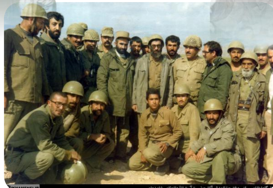
گناه اطلاع رسانی دفتر حقوق نشر آثار حضرت آیت الله العظمی خامنه‌ای